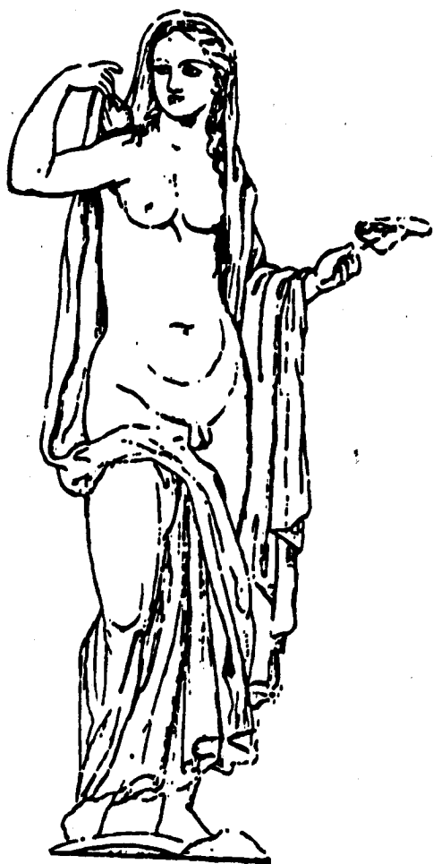
Hermafrodita. Mural de Pompeya.